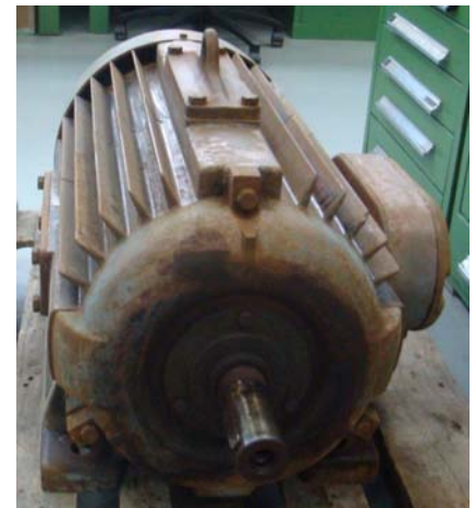
Abb.:1 DoKa-Maschine der Firma Bruncken

Aufgrund der Anforderungen nach drehzahlvariablem Betrieb, Leistungsregelung, geringen Netzurückwirkungen, hoher Verfügbarkeit, niedrigen Kosten sowie langen Wartungsintervallen und hohem Wirkungsgrad kommen prinzipiell nur permanenterregte Synchronmaschinen und Asynchronmaschinen in Frage. Bei den permanenterregten Synchronmaschinen bestehen allerdings durch die Verwendung von Seltenen-Erden-Magneten Abhängigkeits- und Kostenprobleme. Weiterhin müssen diese Generatoren an einem Frequenzumrichter betrieben werden, der auf Nennleistung des Systems ausgelegt werden muss, was die Systemkosten deutlich erhöht. Bei den herkömmlichen Asynchronmaschinen kommt auf den ersten Blick die doppeltespeiste Asynchronmaschine mit Schleifringläufer in