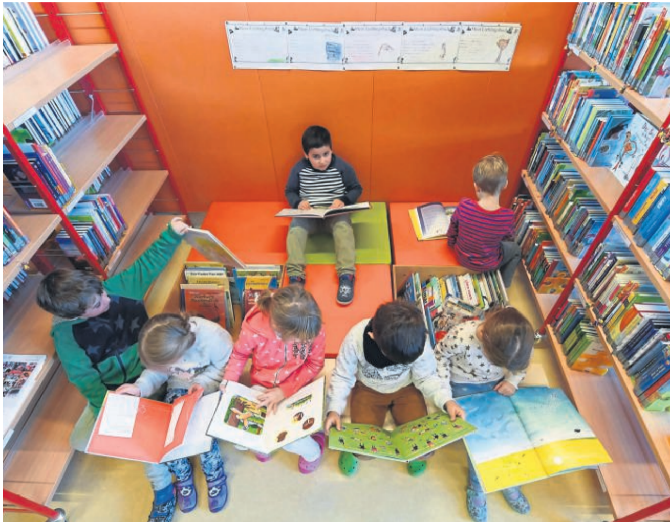
Mädchen und Jungen lesen unterschiedlich: Unser Bild zeigt Schüler der Marie-Curie-Grundschule, die in der Bibliothek der Schule in Frankfurt Bücher lesen.

Allerdings gilt es zu betonen, dass es sich bei diesen Zuordnungen lediglich um geschlechtstypische Tendenzen handelt, die sich nicht eins-zu-eins auf jedes Individuum übertragen lassen. Dieser fundamentalen Verschiedenheit der Geschlechter wird beim schulischen Lesen jedoch kaum Rechnung getragen, was sich besonders nachteilig auf Lesesozialisation und Lesekompetenz der Knaben auswirkt. Zunehmend fehlen insbesondere in den Grundschulen Männer als Bezugspersonen