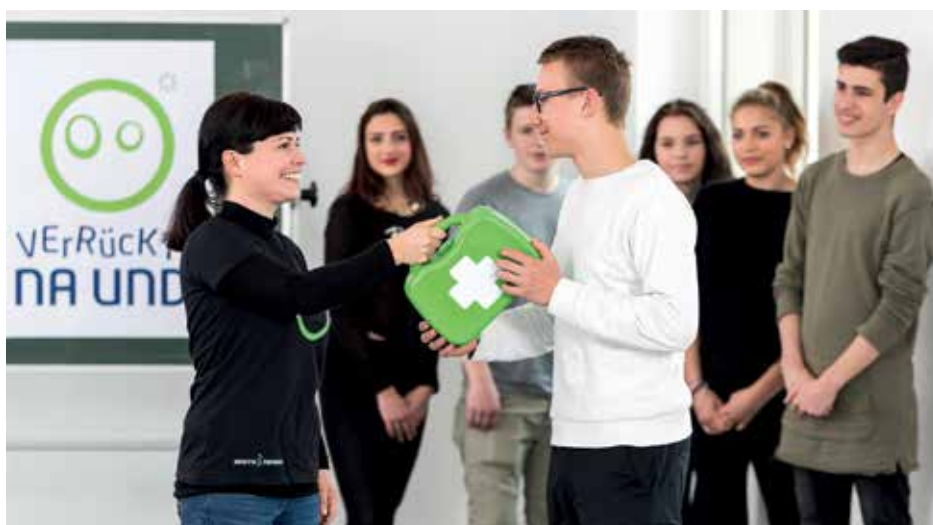
Das Projekt „Verrückt? Na und!“ stärkt junge Menschen.