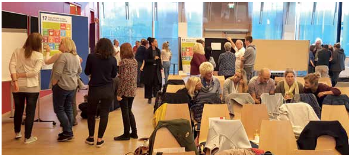
Erste Bestandsaufnahme des Amts für Kultur und Freizeit im Oktober 2018: Wo arbeiten wir bereits nachhaltig?