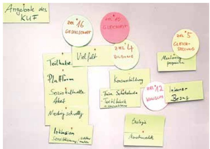
Unterschiedliche Arbeitsschritte bei den Workshops mit dem Amt für Kultur und Freizeit