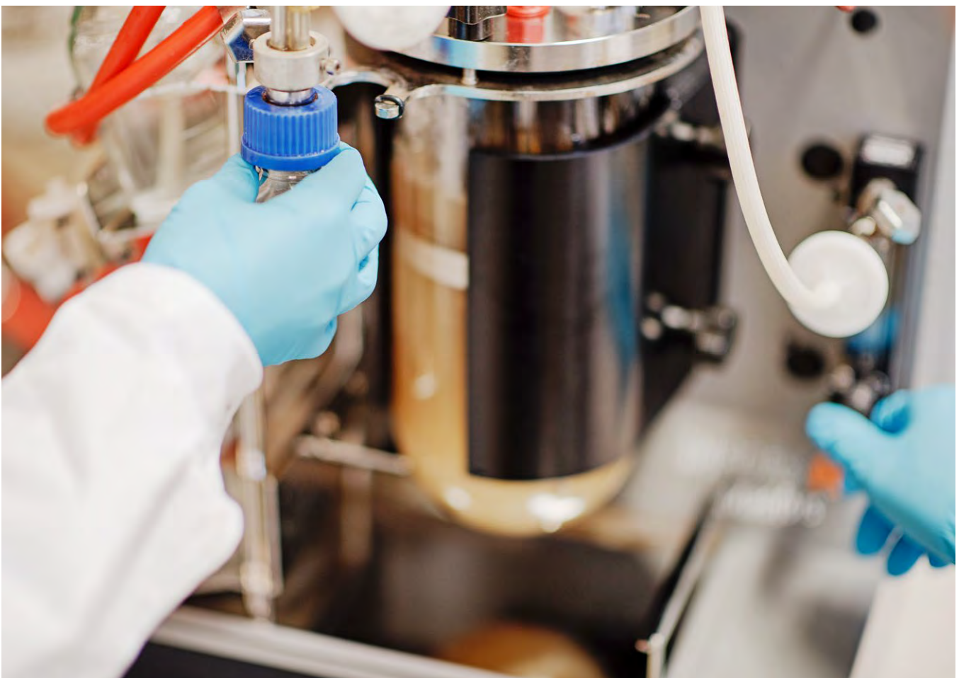
Die Bakterien wachsen in einem Bioreaktor zu einer großen Anzahl heran.