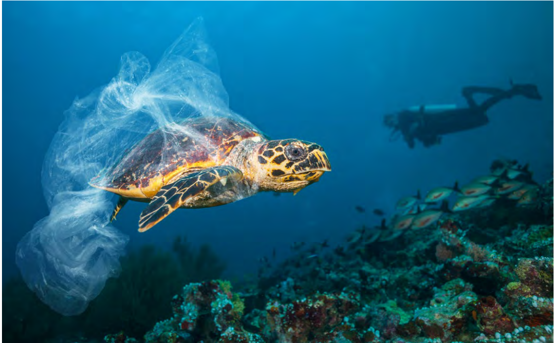
Jedes Jahr landen etwa acht Millionen Tonnen Plastik in den Weltmeeren.

zur Herstellung von Wasserstoff durch Mikroalgen. Den Ansatz, Sonnenlicht, Wasser und Kohlendioxid auch für die Herstellung von PHB durch photosynthetische Mikroorganismen zu nutzen, hat sie nach ersten Berechnungen verworfen: wirtschaftlich nicht sinnvoll. Mit dem Wechsel an die TH Nürnberg kam dann die Veränderung ihres fachlichen Schwerpunkts hin zu Bakterien.