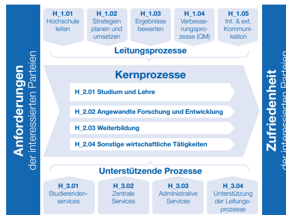
Prozesslandkarte der TH Nürnberg mit den vier Kernprozessen.