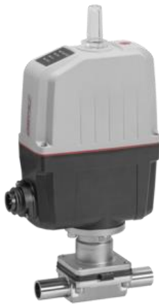
Abbildung 2 Membranventil, Quelle: https://www.gemu-group.com/de_DE/ventiltechnik/membranventile/produktliste/membranventil-639/

Um diese Ventile durch Modelle beschreiben zu können, sind umfangreiche Vorstudien erforderlich. So sollen Volumenströme in den Ventilen simuliert und mit den Messungen eines bestehenden Ventilversuchsstands verglichen werden.